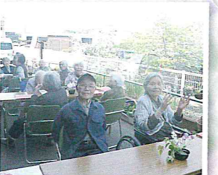
▲晴れた日の園庭茶会