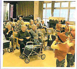
▲八幡保育園の園児との交流会 かわいい踊りを見せてくれました