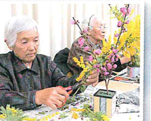
▲季節の花でフラワーアレンジ