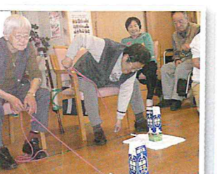
▲牛乳パックが倒れないよう慎重に...