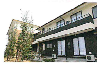
▲グループホーム外観 (正面)

平成20年4月1日、柏台に通常型デイサービス『空の家』(定員1日25名)と認知症対応型デイサービス『風の家』(1日12人)をオープンしており、それぞれの施設とも、専門資格を持つ介護・看護師を配置しています。