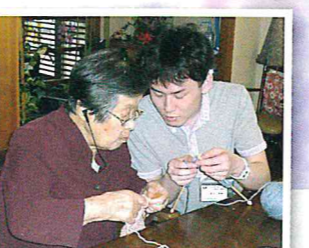
▲こうして、ここを潜らせるんよ 編物を教える利用者(左)