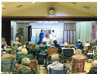
▲芝居を熟演する伊つき座 様