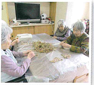
▲つくしの「はかま」を丁寧に、佃煮を作りました 「ええ味になっとるよ!」