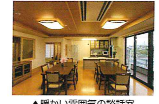
▲暖かい雰囲気の話談室