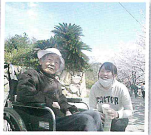
▲丸山公園、酒津公園でのお花見 最高の天気にも恵まれました