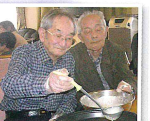
▲協力してクレープづくり