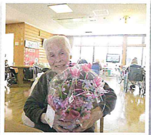
▲誕生日に素敵なお花をもらいました