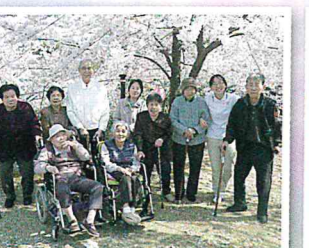
▲丸山公園で満開の桜見物