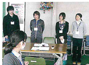
▲グループ発表の様子

あすなる園では、毎年4月に入社する新規採用職員を対象に、3月下旬から4月にかけて、約10日間のカリキュラムを組んで研修を行なっています。研修内容としては、法人理念や基本的な介護技術の体験など、多種にわたっています。今年度は外部講師も招き、社会人としての接遇マナーや認知症ケアについても学びました。この研修を通して、共に働く仲間として切磋琢磨し、助け合える信頼関係を構築しています。