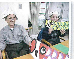
▲端午の節句の飾りです