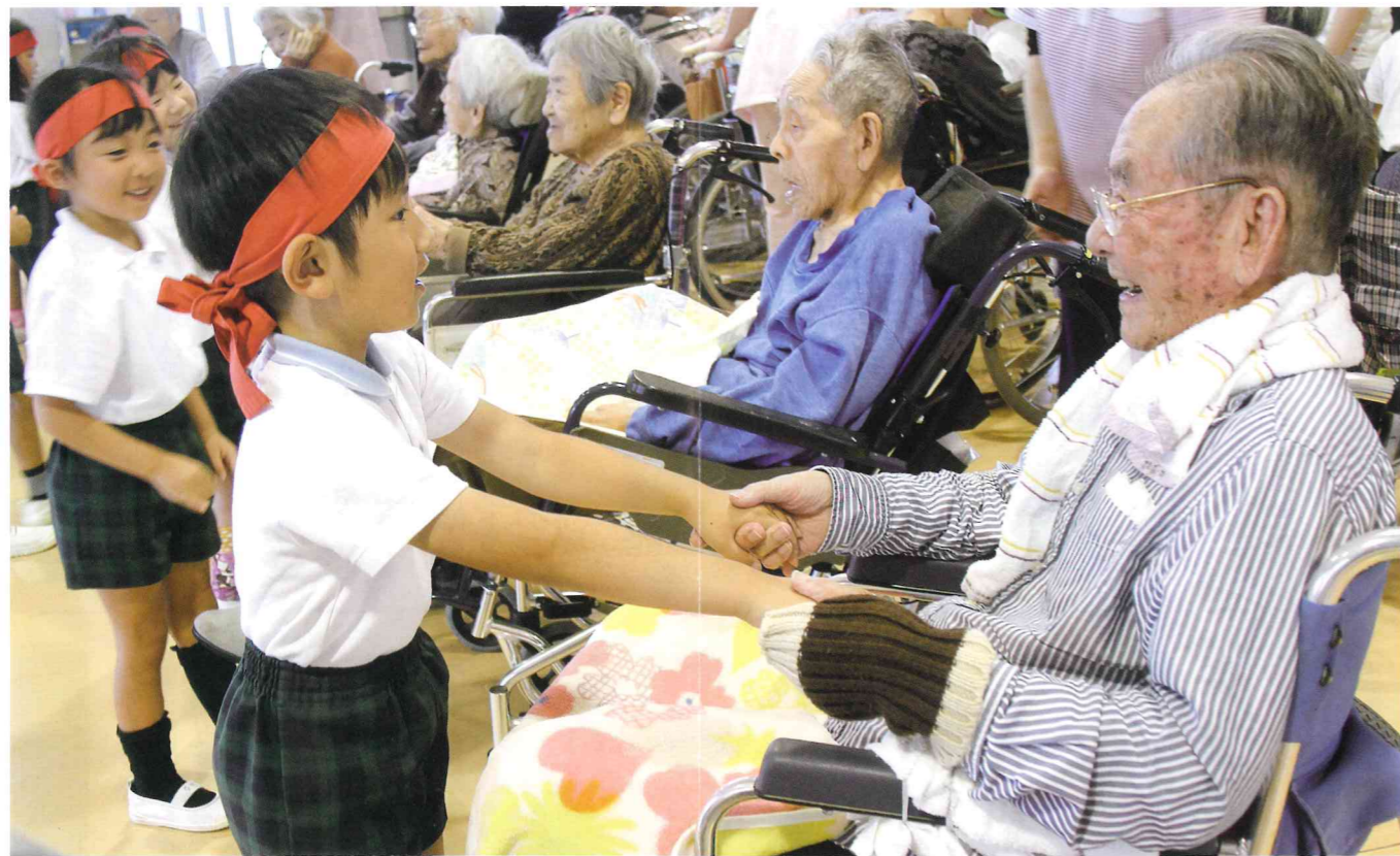
▲「おじいちゃん遊ぼう!」「オオッ可愛いね!」八幡保育園児と運動会を楽しむ入園者