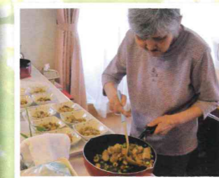
▲もう少しでお昼ご飯ですよ〜