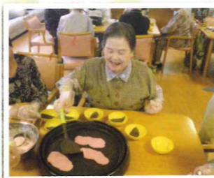
▲おいしい桜餅を作ってます