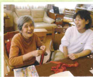
▲今日も笑顔が絶えません