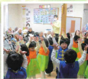
▲たくさんの園児が来園。かわいい踊りとふれあいで、入園者も笑顔いっぱいでした