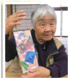
▲端午の節句の タペストリーを作りました