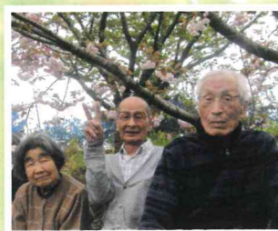
▲八重桜がとっても綺麗でした