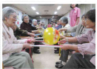
▲転倒予防体操がんばってます！