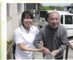
▲デートの帰りですか！？