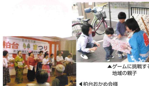
▲ゲームに挑戦する地域の親子 ▲柏台おかめ会様

5月9日、初夏の爽やかな気候の中、第7回 あすなろ園柏台まつりが盛大に催されました。地域の皆様のご協力のもと、今年度は170人以上の来場者があり、屋台やゲストステージを楽しんでいただくことができました。昨年の5月に柏台グループホームがオープンし、グループホームとデイサービスの共催となったことで、今年度より「あすなろ園柏台まつり」と改名しました。まつりを通して地域の皆様との交流を深めていただけるよう努力を重ねて参ります。今後とも宜しくお願ひします。