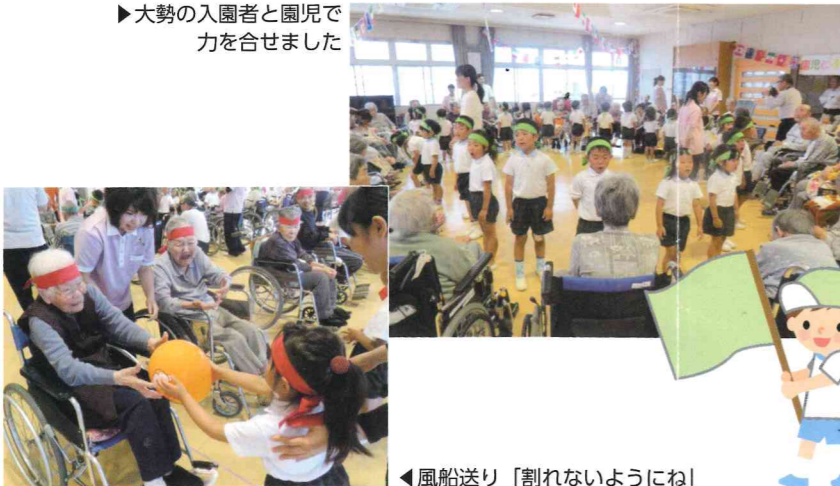
◀風船送り「割れないようにね」