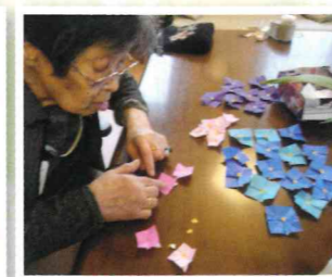
▲あじさいの壁画づくり