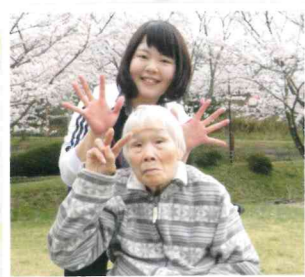
▲満開の桜の下で、ハイ・ポーズ！