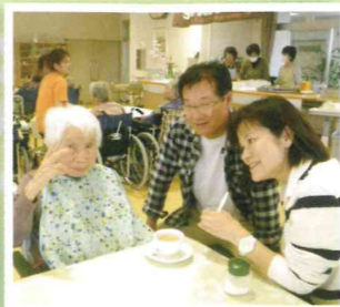
▲家族や職員とのふれあいのひと時