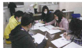
▲グループワークで意見交換

今年度、4月1日付けで12名の新卒職員が入職しました。短大や専門学校、大学を卒業し、学生生活最後の春休みを満喫する暇もなく、新規採用職員対象の研修に参加しています。研修では、法人の理念や、社会人としての接遇マナー、介護技術などを学ぶことを目的としていますが、4月から共に働く仲間として切磋琢磨し、悩みや喜びを共有できる関係を築けるように、様々なグループワークも行なっています。