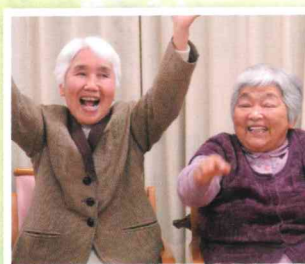
▲笑いヨガ 「ほ・ほ・ははは・いえ〜い」