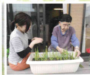
▲おいしいネギが収穫できました 「みそ汁に入れるかな〜」