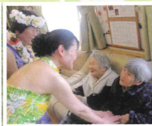
▲フラダンス良かったよ〜