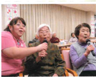
▲カラオケ、盛り上がってます！